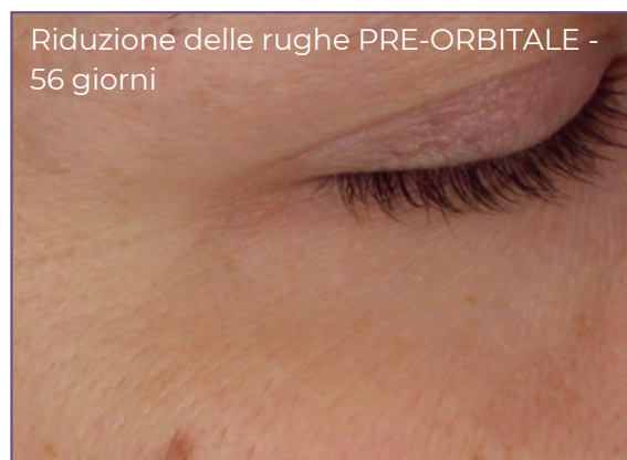
Riduzione delle rughe PRE-ORBITALE - 56 giorni